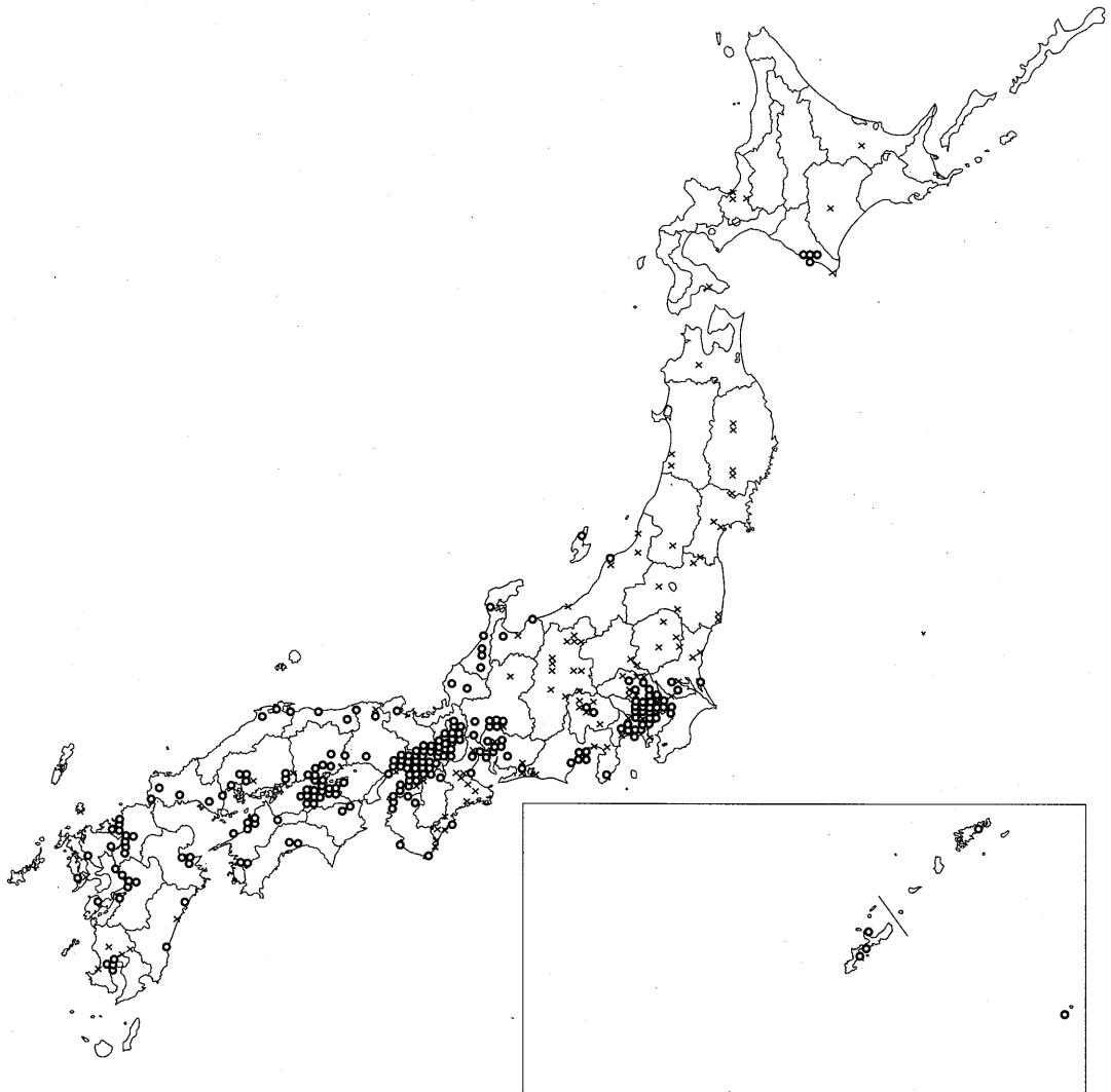
図1：日本全体のヤモリの分布図。○：少なくとも稀にはヤモリの確認が報告された地点（ヤモリアンケートのランク a, b, c）、×：報告があったがヤモリがまったく確認されなかった地点（ヤモリアンケートのランク d）。

近畿地方以西の西日本では、ヤモリは海岸部から内陸部まで、広く連続的に分布している。一方、近畿地方よりも東では、南関東から東海、及び富山県以西の北陸にはほぼ連続的に分布しているが、それよりも北には新潟県や北海道の海岸部に飛び地的な生息地が存在するのみである。北海道で生息が確認されたのは、すべて浦河郡浦河町であり、牧場または牧場の近くの家屋であった。少なくとも中部地方以北においては、長野県にはまったく分布していないなど、内陸よりも海岸部に分布する傾向が見て取れる。