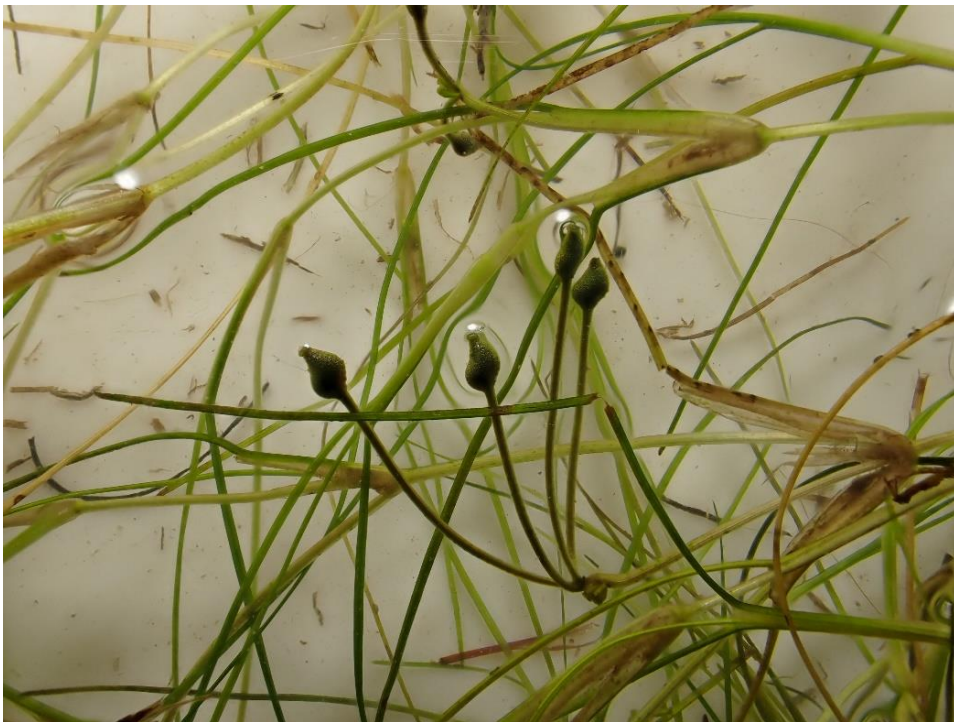
図 4 : カワツルモの特徴的な果実