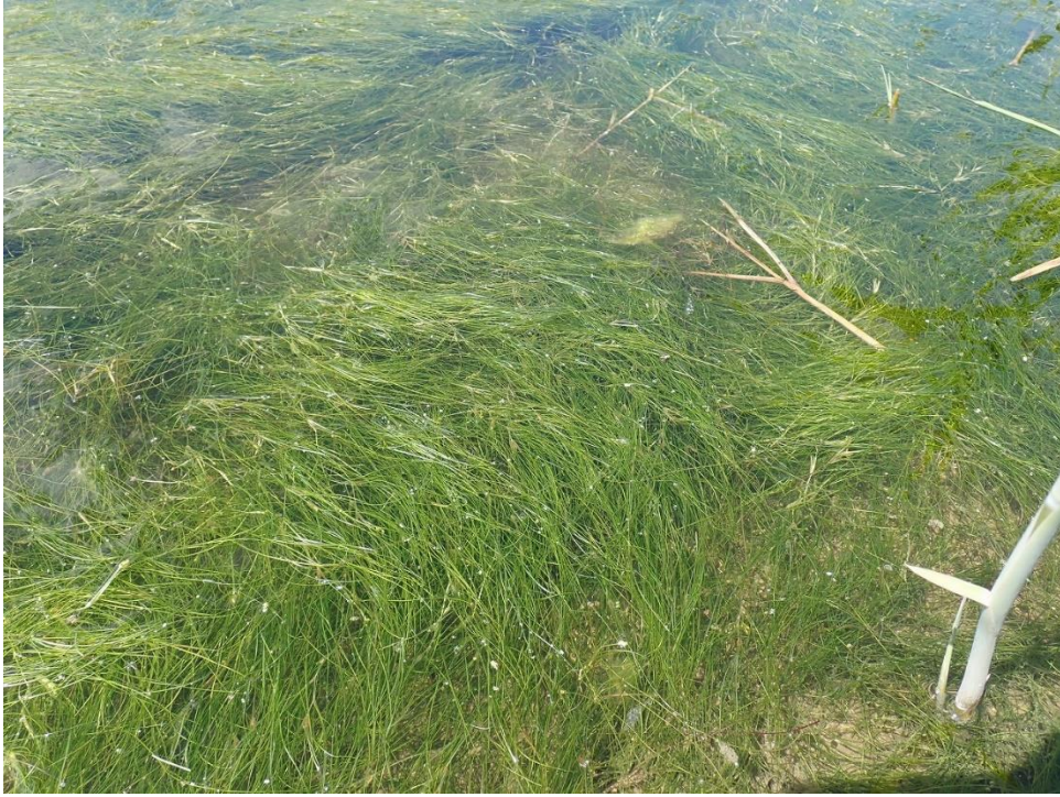
図 3 : 夢洲で発見されたカワツルモ