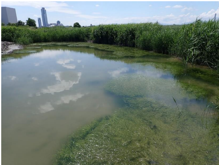
図2：夢洲で発見されたカワツルモの生育環境