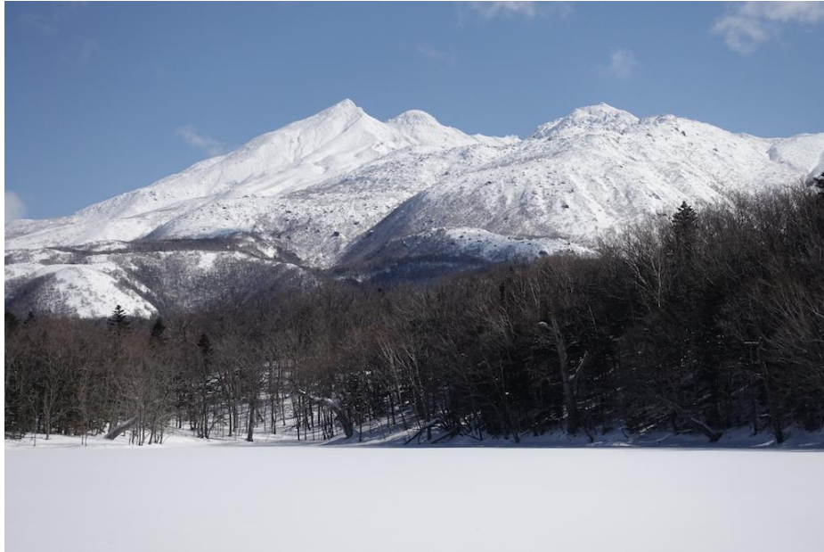
知床五湖から見た知床硫黄山。3700年前に山体崩壊が発生し、現在の山容になった。

知床硫黄山は北海道・知床半島にある活火山です。大量の溶融硫黄を噴出する世界的にもとても珍しい火山です。知床硫黄山の地質やその歴史から、知床硫黄山の全貌を紹介します。