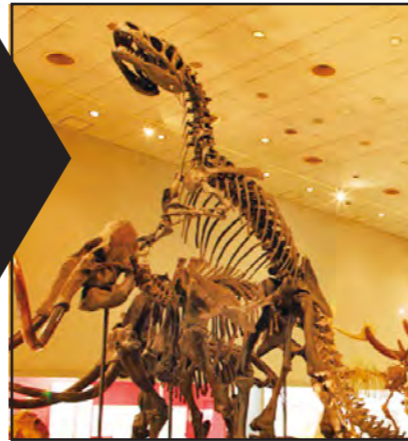
現在展示されている旧標本