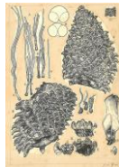
三木茂のオオミツバマツの新種記載の図