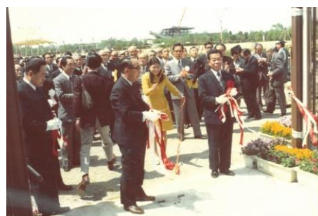
1974(昭和49)年4月27日 オープニングセレモニーの様子